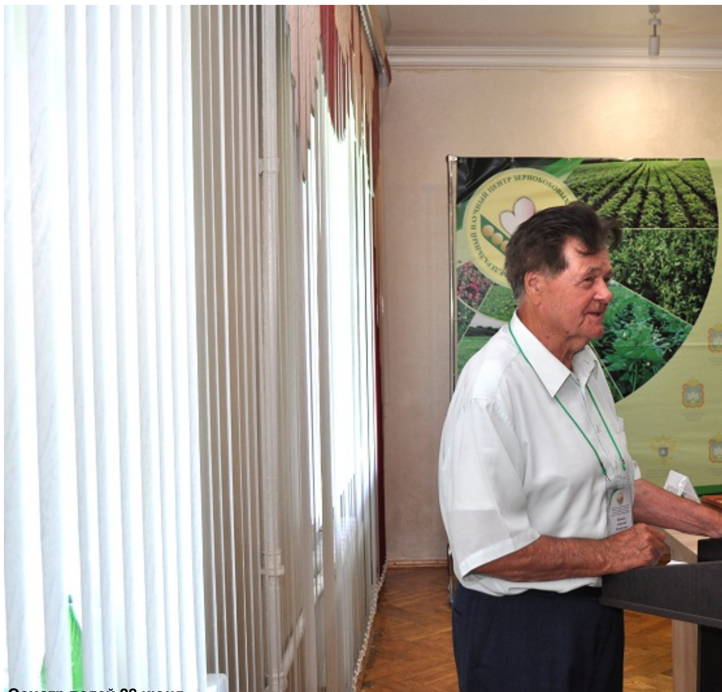
Осмотр полей 28 июня